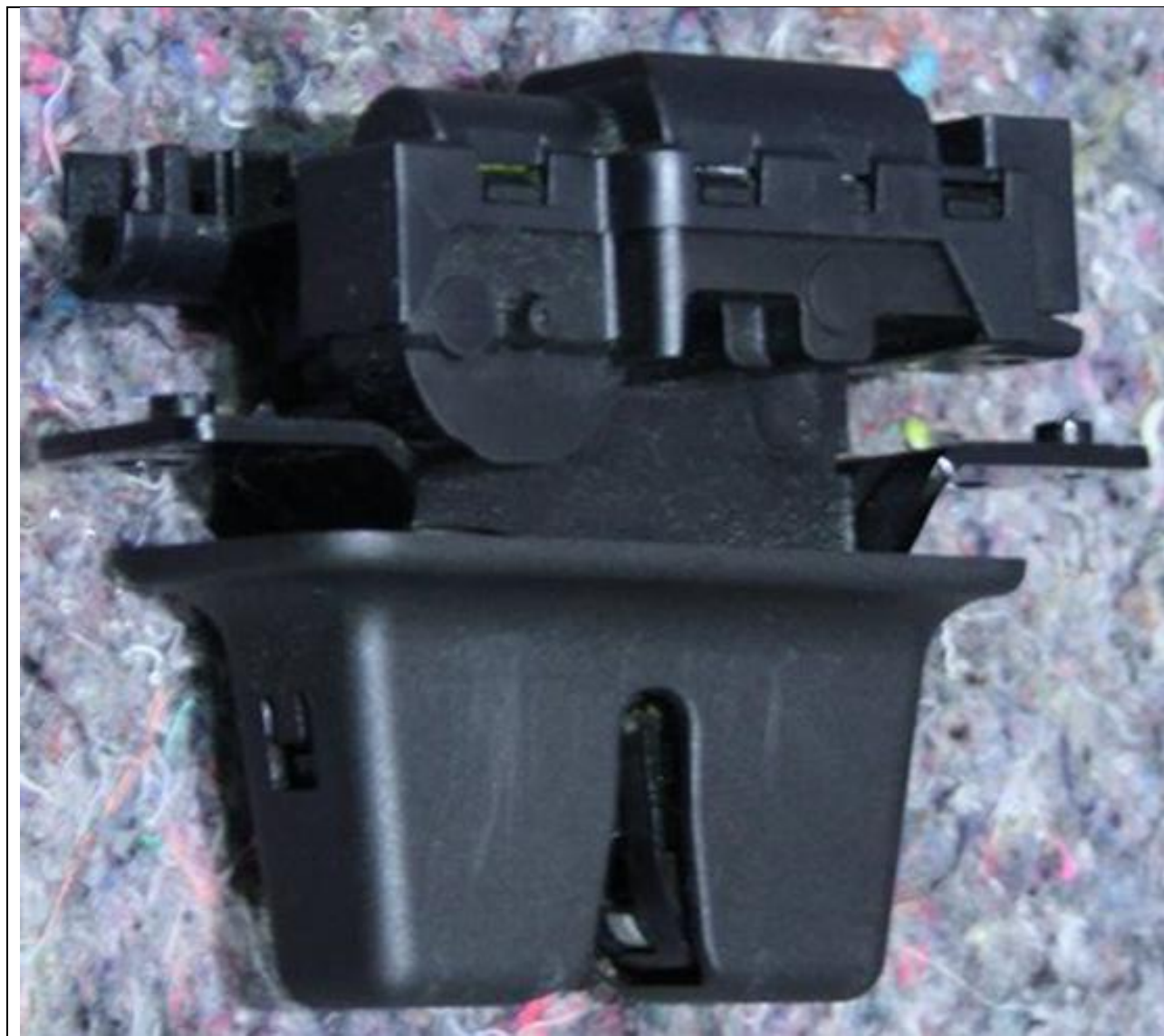
Cerradura con la cubierta/funda de plástico que cubre el diente de cierre y que aísla de tocar la grasa