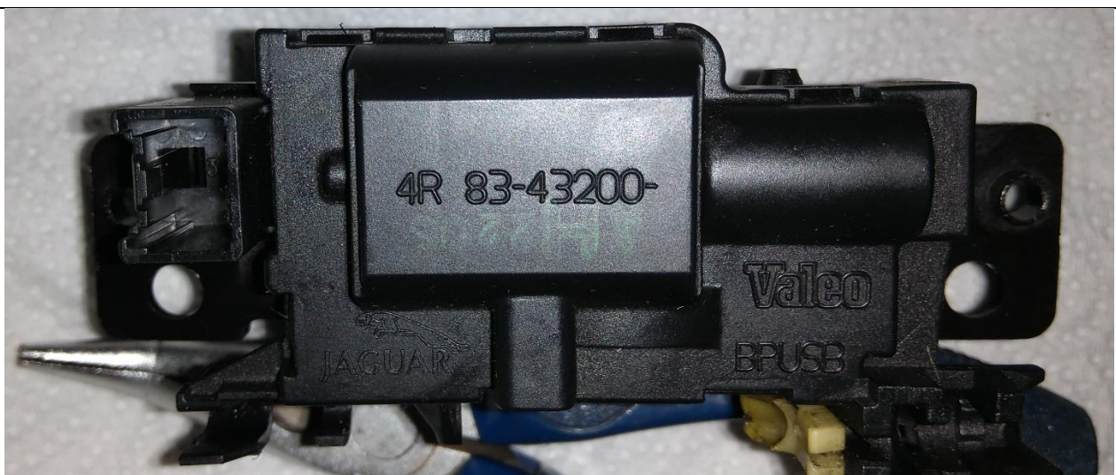
Vista de la parte superior de la cerradura, que queda escondida en el portón. Se ve la referencia de Valeo